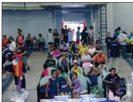
A gincana foi o evento com a maior participação de funcionários no HES, o que surpreendeu a organização