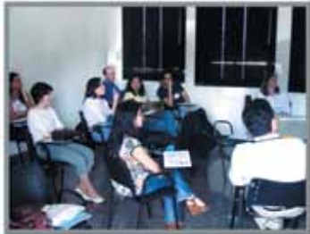
■ Nov. 2008 HES realiza curso Trauma na Criança como atividade pré-congresso do XXI Panamerican Congress Of Trauma realizado em Campinas