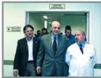
■ Dez 2008 Governador entrega AME Cirúrgico de Sta Bárbara vinculado a Unicamp