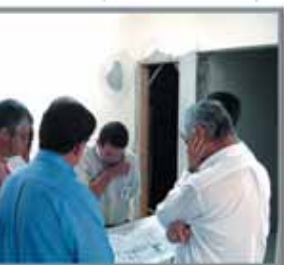
■ Jul. 2008 Equipe do HES visita obras do AME de Piracicaba sob responsabilidade da Unicamp