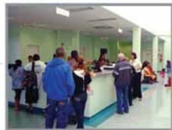
■ Out. 2008 HES realiza treinamento para equipes do SAMU Sumaré-Hortolândia