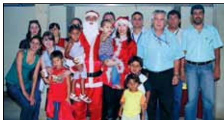
Acima, funcionários do HES entregam presentes às crianças da Creche Santa Clara. Ao lado, a partida para o PETI Cruzeiro e a expectativa das crianças