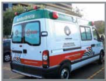
■ Set. 2008 HES celebra seus 8 anos com gincana, shows e a entrega da nova ambulância