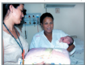
Jan. 2007 Grupo de Voluntários do HES Viva Feliz passa a fornecer kit maternidade completo para todas as mães carentes com filhos nascidos no HES