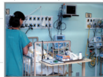
Jun. 2007 Inauguração da UTI Pediátrica