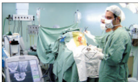
Cirurgia custa R$ 50 mil em hospitais particulares

A equipe de neurocirurgiões do HES realizou com sucesso uma neurocirurgia para realização de uma biópsia guiada em um tumor do tronco cerebral, utilizando um equipamento de neuronavegação. A tecnologia de última geração, que só é usada em centros de referência da rede privada e na USP, permitiu à equipe de cirurgiões, localizar e atuar em áreas profundas do cérebro com menor risco de lesões ao paciente. Os instrumentos utilizados no procedimento são projetados em tempo real sobre os modelos tridimensionais de visualização que auxiliam no planejamento pré-operatório e na localização precisa do tumor durante toda cirurgia.