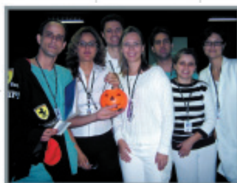
Mar. 2007 Enfermagem cria programa "Café com Resultados" - Reunião realizada mensalmente com supervisores de enfermagem para avaliação das metas e melhorias