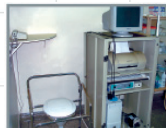
Abr. 2007 Hospital inclui serviço de urodinâmica em sua rotina